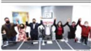
TIJUANA. Los resultados agradables de las elecciones y un mayor apoyo a seguir trabajando en la defensa de la Cuarta Transformación.