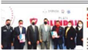
ENSENADA. La Familia General del Estado (FGE) se integró al Plan Blindaje Ensenada 2021 como resultado de trabajo de...