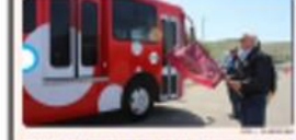
TIJUANA. Importante nueva ruta de transporte de Villa del Campo - Centro, que entrará a...