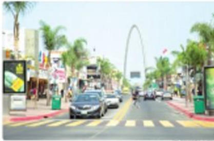
TIJUANA. El sector turístico espera que la Semana Santa 2021 sea un buen momento largo de nueva actividad por la pandemia de COVID-19.

TIJUANA. De acuerdo al Comité de Turismo y Convenciones de Tijuana (Cotuco), el sector turístico registra 52 mil visitantes nacionales y extranjeros durante la Semana Santa, que significa una derrama económica de aproximadamente 3.5 millones de dólares, con lo cual se busca motivar el sector de una manera progresiva.